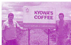
KYOWA'S COFFEE専用の豆として栽培。