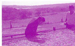
収穫した豆を入念にチェック。

☆KYOWA'S COFFEEのO.M.コーヒー鑑定士が、最上質の豆を求めて、ブラジルを訪れたのは2004年のこと。それから4年、遂に皆様のもとへこだわりのコーヒーをお届けできるようになりました。